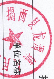
揭西县龙潭镇人民政府 2024 年度行政检查实施情况统计表